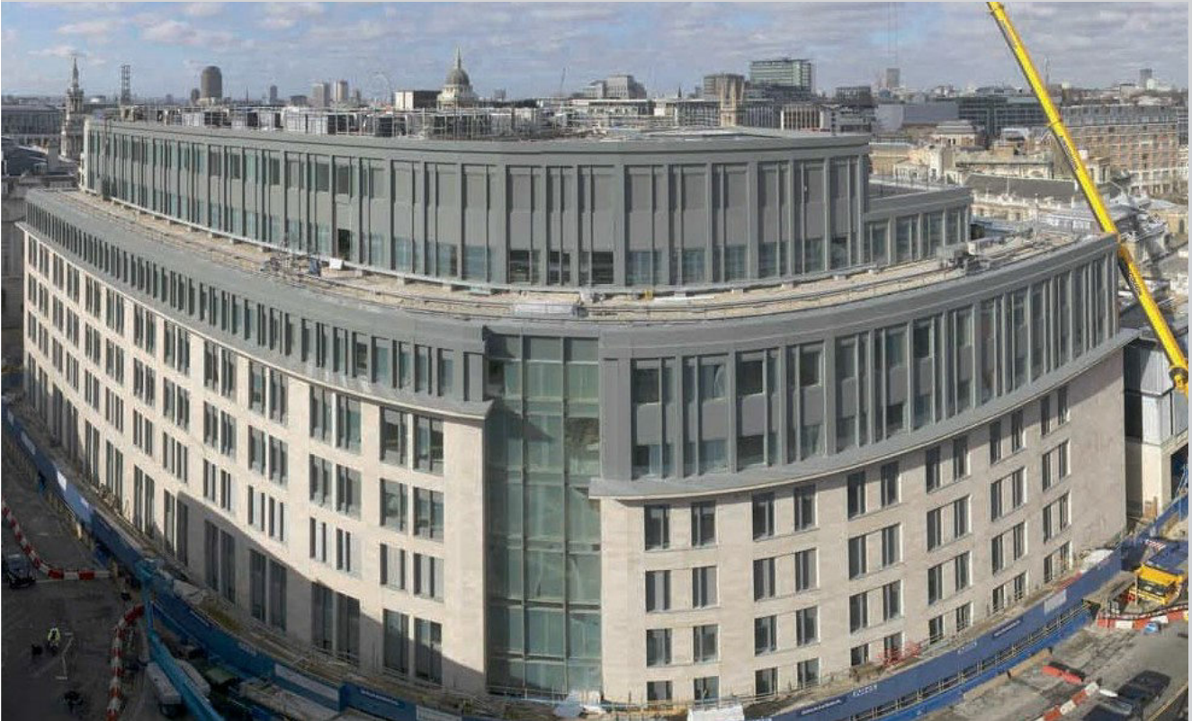
নতুন ভবন নির্মিত হচ্ছে ফ্যারিংডনে সেন্ট বারথেলোমিউস হাসপাতালে।